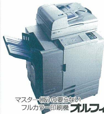
マスター(版)の要らない フルカラー印刷機 オフィス